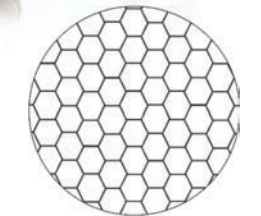
Tecnologia htt® BLUELINE